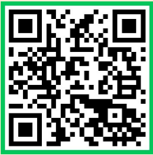
장애인의 의사소통 권리

장애 유형에 따라 소통하는 방법은 다를 수 있어요. 소통 방법을 알아보고, 상황에 맞는 방법으로 소통을 해봐요!