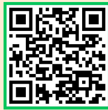
발달장애인의 의사소통 방법