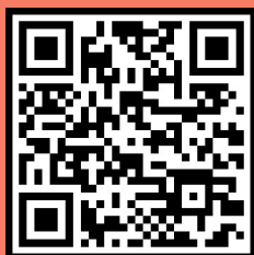
지양해야 하는 표현